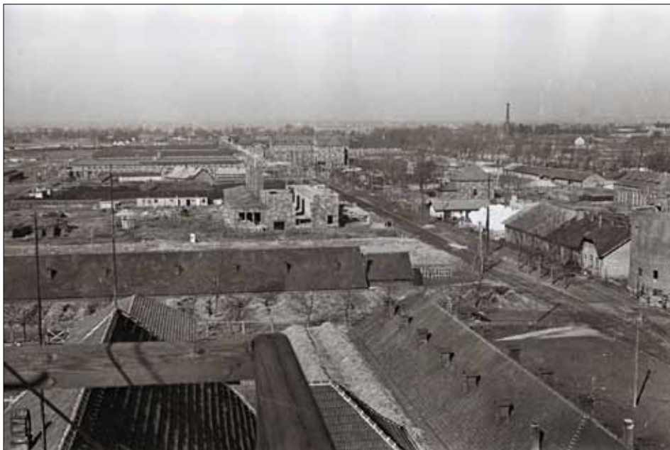
Загальний вигляд концтабору Аушвіц. м. Освенцим (Польща), січень–лютий 1945 р. Фото В. П. Юдіна ЦДКФФА України ім. Г. С. Пшеничного, од. обл. 0-161190.