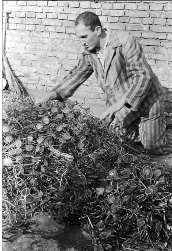
Окуляри в'язнів, страчених у концтаборі Аушвіц, м. Освенцим (Польща), січень–лютий 1945 р. Фото В. П. Юдіна ЦДКФФА України ім. Г. С. Пиєничного, од. обл. 0-161104.