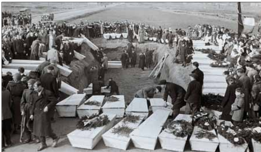
Похорон в'язнів концтабору Аушвіц. м. Освенцим (Польща), січень 1945 р. Фото В. П. Юдіна. ЦДКФФА України ім. Г. С. Пшеничного, од. обл. 0-161127.

On the occasion of 70th anniversary of the liberation of the Nazi concentration camp Auschwitz and International Holocaust Remembrance Day the article presents photo documents of the collection of V.P. Yudin, the frontline photographer. Author used documents stored in the Central State Audio and Visual Documents Archives of Ukraine named after H.S. Pshenychnyi.