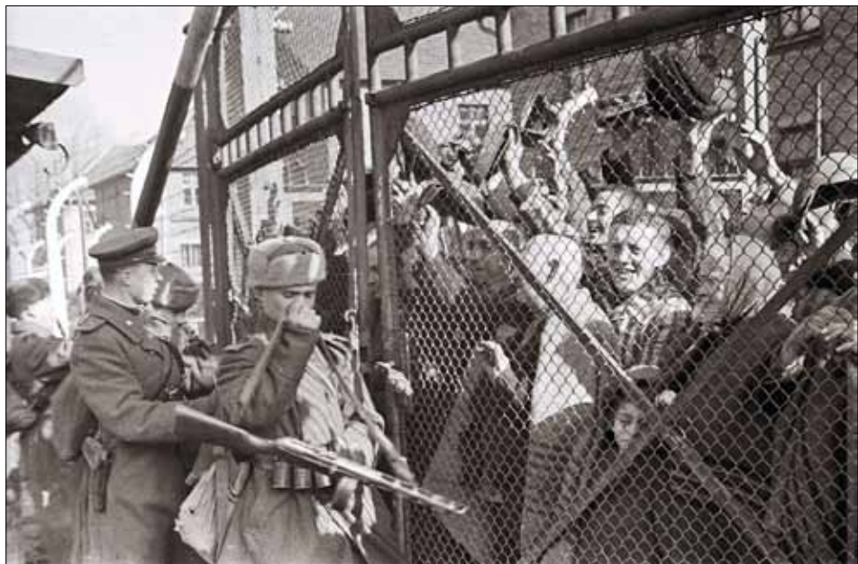
Радянські воїни відчиняють ворота концтабору Аушвіц, м. Освенцим (Польща), січень–лютий 1945 р. Фото В. П. Юдіна. ЦДКФФА України ім. Г. С. Пиєничного, од. обл. 0-161209.