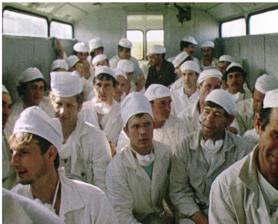
Група ліквідаторів перед відправленням на ЧАЕС.