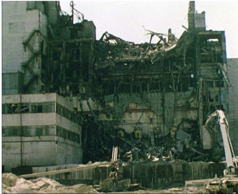
4-й енергоблок ЧАЕС після аварії. Прип'ять Чорнобильського р-ну Київської обл., 1986 р. З фондів ЦДКФФА України ім. Г. С. Пшеничного, од. обл. 10708