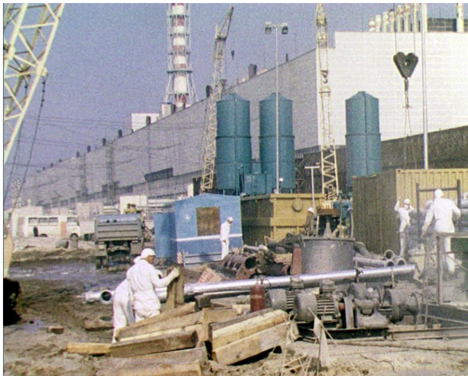
Роботи зі зведення захисного перекриття 4-го енергоблоку ЧАЕС.