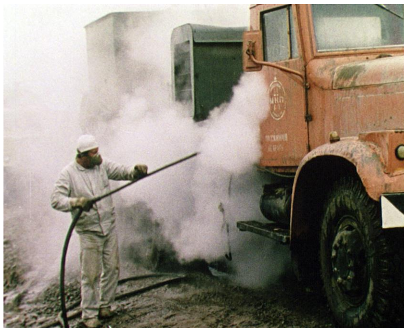
Дезактивація радіаційно забрудненого транспорту. З фондів ЦДКФФА України ім. Г. С. Пшеничного, од. обл. 10708