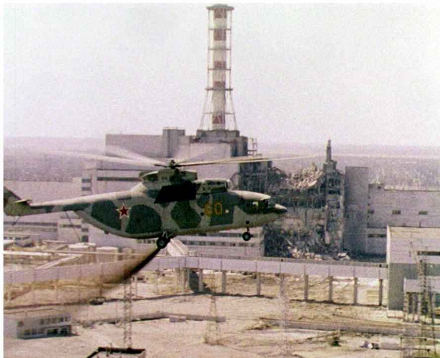
Вертоліт проводить дезактивацію території 4-го енергоблоку ЧАЕС. Прип'ять Чорнобильського р-ну Київської обл., 1986 р. З фондів ЦДКФФА України ім. Г. С. Пшеничного, од. обл. 10708