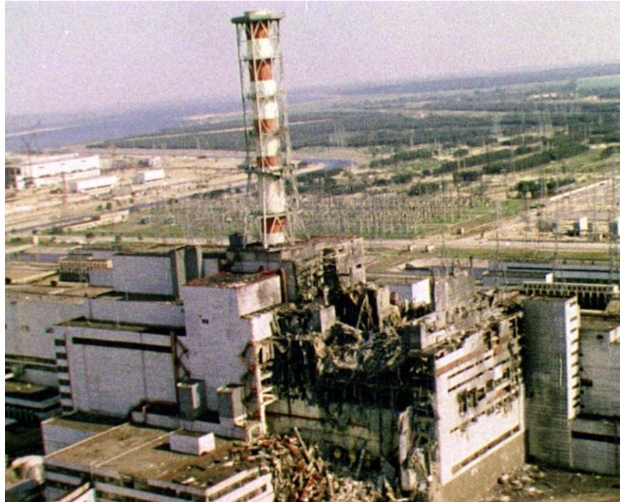
Загальний вигляд ЧАЕС після аварії. Прип'ять Чорнобильського р-ну Київської обл., 1986 р. З фондів ЦДКФФА України ім. Г. С. Пшеничного, од. обл. 10708