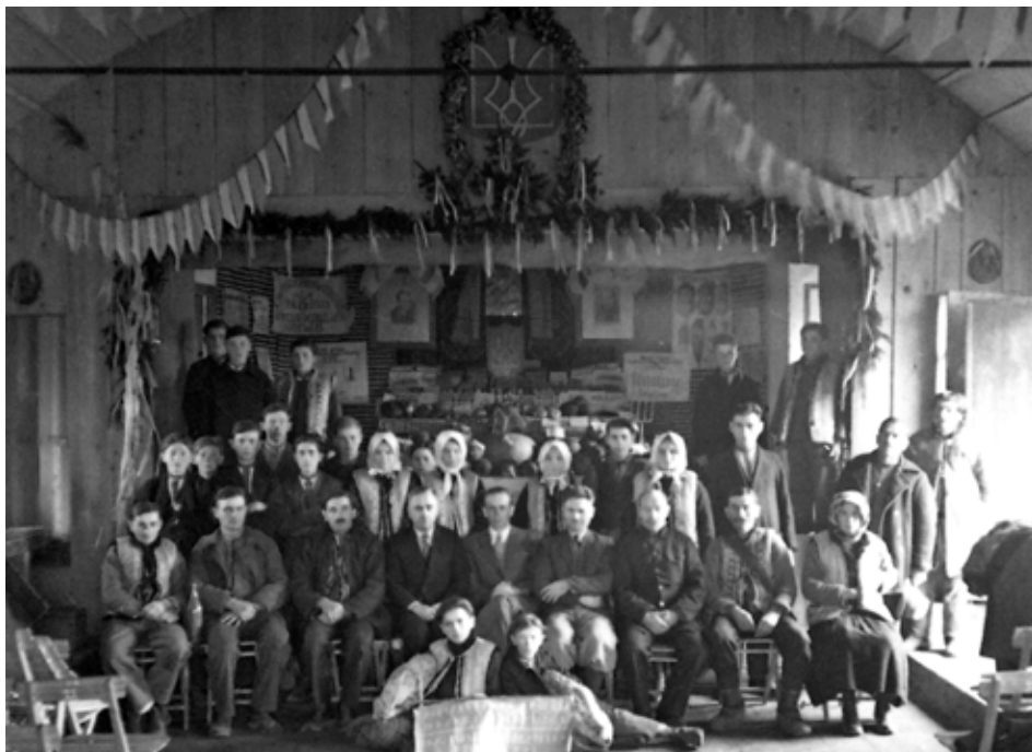
Товариство “Сільський господар” у с. Коршів [1937 р.].