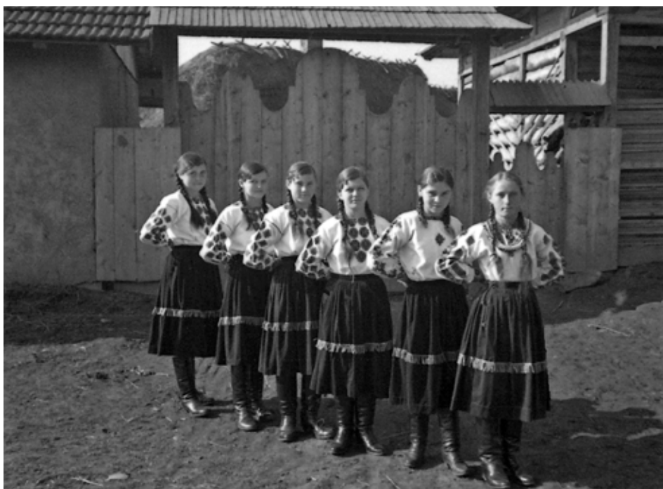
“Хліборобський Вишкіл Молоді” при товаристві “Сільський господар” у с. Балинці, 20 березня 1938 р.