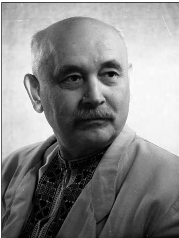
Г. Г. Верьовка – український композитор і хоровий диригент, педагог, народний артист УРСР. 1962 р.