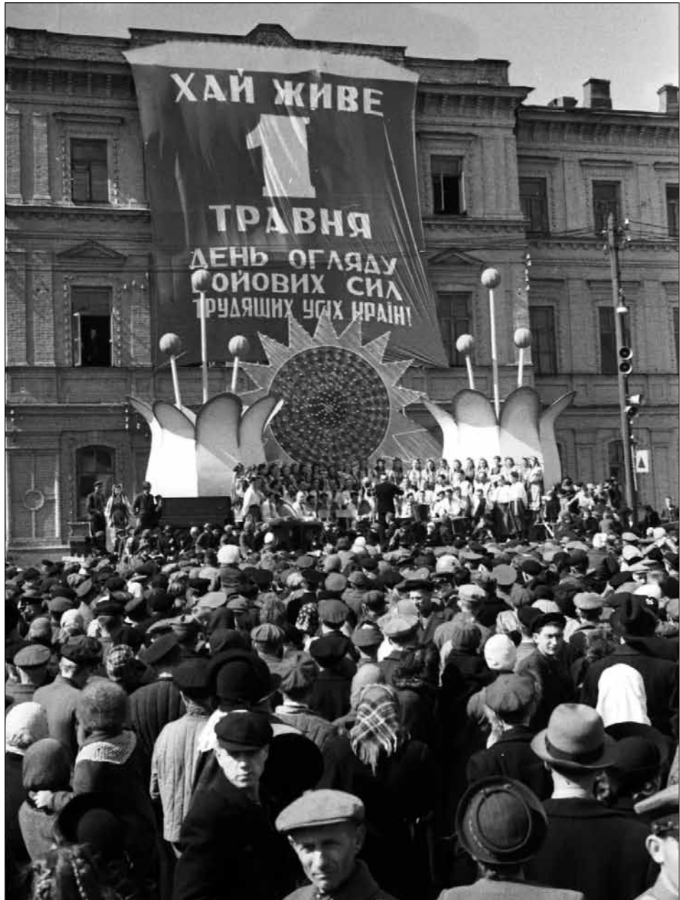
Виступ Державного українського народного хору під орудою заслуженого діяча мистецтв Г. Г. Верьовки на пл. Богдана Хмельницького в день відкриття передсвяткового першотравневого вуличного базару.