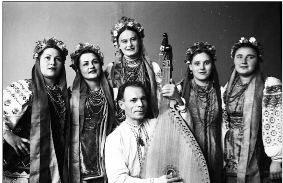
Група артистів Державного українського народного хору під час виступу в Московській військово-політичній академії ім. В. І. Леніна. м. Москва, 3 листопада 1946 р.

Пропонуємо добірку фотодокументів із фондів ЦДКФФА України ім. Г. С. Пшеничного.