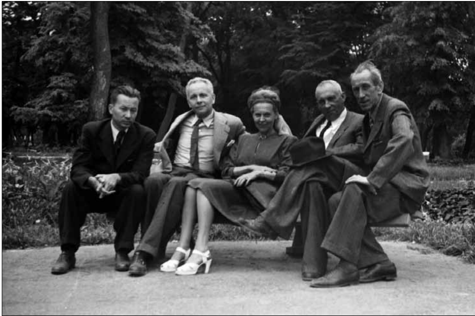
Українські та французькі письменники: (зліва направо) А. Малишко, Л. Арагон, Е. Триоле, М. Рильський, В. Перегуда м. Київ, 6 серпня 1947 р.

ЦДКФФА України ім. Г. С. Пшеничного, од. обл. 0-31168.