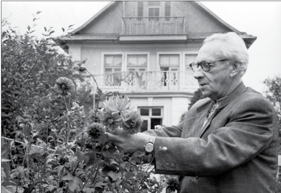
М. Т. Рильський біля свого будинку в Голосієво. м. Київ, 4 жовтня 1958 р. ЦДКФФА України ім. Г. С. Пшеничного, од. обл. 0-85473.

міністративний пресинг) й представника старшого покоління письменників, які духовно підтримали українське літературне шістдесятництво (стрічки “И голос наш услышит мир”, (1989, од. обл. 10944), “Микола Вінграновський” (1993, од. обл. 11724).