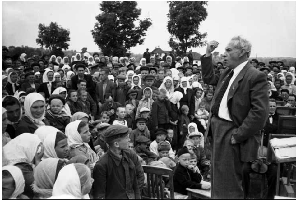
М. Т. Рильський виступає на урочистому мітингу, присвяченому 150-річчю з дня народження О. С. Пушкіна, в селі Кам'янка Кіровоградської області (зараз місто Кам'янка Черкаської області). с. Кам'янка, 28 травня 1949 р. ЦДКФФА України ім. Г. С. Пшеничного, од. обл. 0-86068.

2502, 2507, 2677, 2687, 3977, 3440). Використовується й образ Рильського-громадського діяча. Так у листопадовому (№61) 1945 р. та січневному (№1) 1946 р. випусках “Радянської України” (од. обл. 259, 267) показано поета під час засідань Центральної виборчої комісії у виборах до Ради Національностей Верховної Ради СРСР, різноманітних заходах “на захист миру” (“Радянська Україна”, № 24, 1949, од. обл. 616 та “Радянська Україна”, № 39, 1950, од. обл. 720), зафіксована участь поета у роботі XXII з’їзду Компартії України, XXII з’їзду КППС (од. обл. 2345, 2351, 3459, 3970). Презентацією офіційної державно-громадської оцінки діяльності М. Т. Рильського стали сюжети про проведення заходів з нагоди відзначення шістдесятиріччя та шістдесятип’ятиріччя від дня народження поета та п’ятдесятиріччя його творчої діяльності (од. обл. 1127, 2095, 3665).