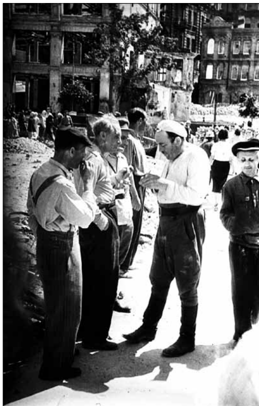
Українські письменники: В. Сосюра, М. Рильський (другий зліва), А. Безименський на відбудові вулиці Хрещатик. м. Київ, 1944 р.

минуле, теперішнє і майбутнє культури, що ініціює той чи інший акт комеморації” 4 .