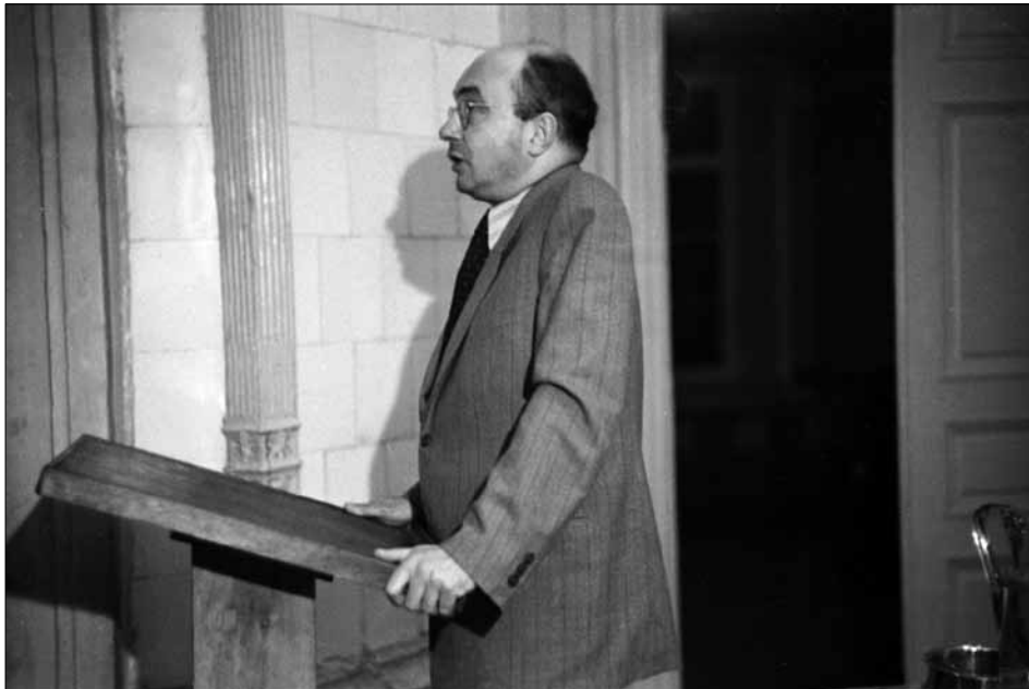
М. П. Бажан виступає на мітингу в Спілці письменників України . Київ, 3 вересня 1953 р.