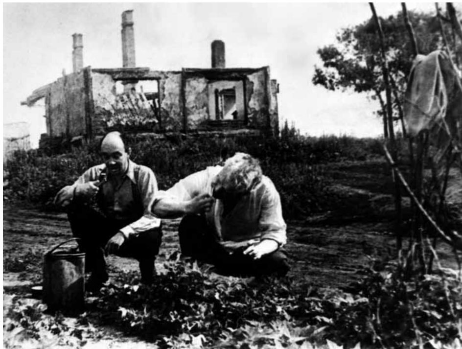
М. П. Бажан (зліва) і О. П. Довженко. м. Валуйки Белгородської області (РРФСР), 1943 р.

ЦДКФФА України ім. Г. С. Пиєничного, од. обл. 0-196007.