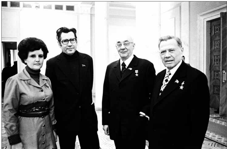
М. П. Бажан (третій зліва) в перерві між засіданнями ІХ сесії Верховної Ради УРСР 9-го скликання. Київ, грудень, 1978 р. ЦДКФФА України ім. Г. С. Пиєничного, од. обл. 0-200611.