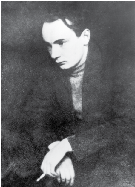
Український поет М. П. Бажан. 1920-і рр.

Студієць Леся Курбаса, учасник очолюваної Михайлем Семенком Асоціації панфутуристів (Аспанфут) та Комункульту, член ВАПЛІТЕ, соратник Миколи Хвильового з його мрією про нову літературу, товариш Юрія Яновського і Олександра Довженка, активний творець