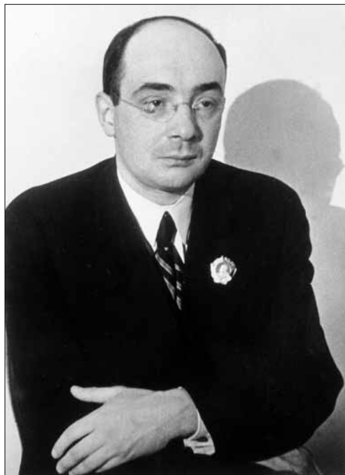
М. П. Бажан. м. Київ, 1939 р.

нюанси, своєрідність створення фотографічного образу, у якій через зовнішнє, публічне, проступає індивідуальне, особисте, поетове самопроекування свого образу й певною мірою самосприйняття. Такі знімки опосередковано оживлюють історичний контекст і перебування в ньому фотографованої особи, включають у себе історичні умови, за яких ці фотографії були зроблені, “за яких вони відбулися”.