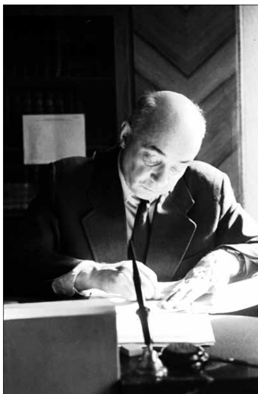
Академік АН УРСР М. П. Бажан за роботою. Київ, 1960-і рр. ЦДКФФА України ім. Г. С. Пшеничного, од. обл. 0-182261.