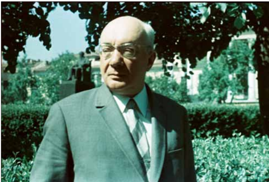
М. П. Бажан – український поет, перекладач, академік АН УРСР, лауреат державних премій СРСР. Київ, 1967 р.

ЦДКФФА України ім. Г. С. Пшеничного, од. обл. 0-106481.